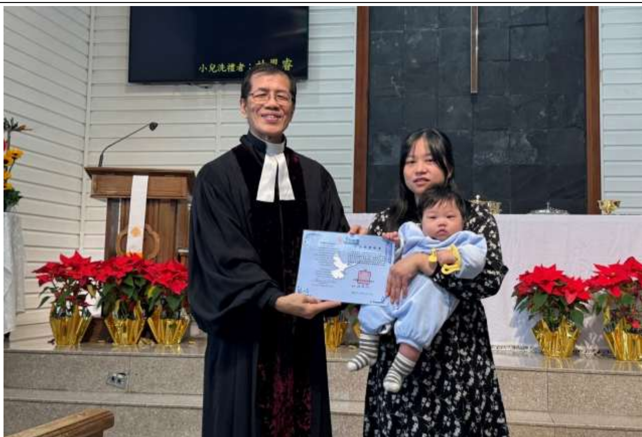
圖上：2026/1/11 第一次聖禮典第二場禮拜小兒洗禮

耶穌說：「我寧在告訴你們，你們若不回轉，變成小孩子的樣式，斷不得進天國。所以，凡自己謙卑像這小孩子的，他在天國裡就是最大的。凡為我的名接待一個像這小孩子的，就是接待我。」(馬太福音十八：3-5)