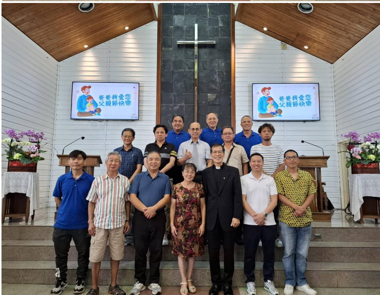
圖上、下：2025/8/3 父親節感恩禮拜主日第一、二場禮拜父親合照 父親怎樣憐恤他的兒女，耶和華也怎樣憐恤敬畏他的人！（詩篇一〇三:13） 子孫為老人的冠冕；父親是兒女的榮耀。（箴言十七:61）