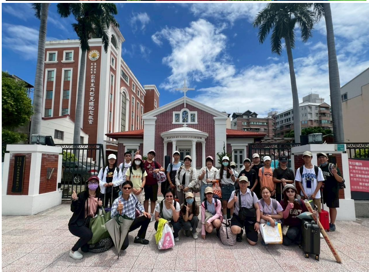
圖上：2025/7/2~7/4 參加北中兒少營會-司馬限部落