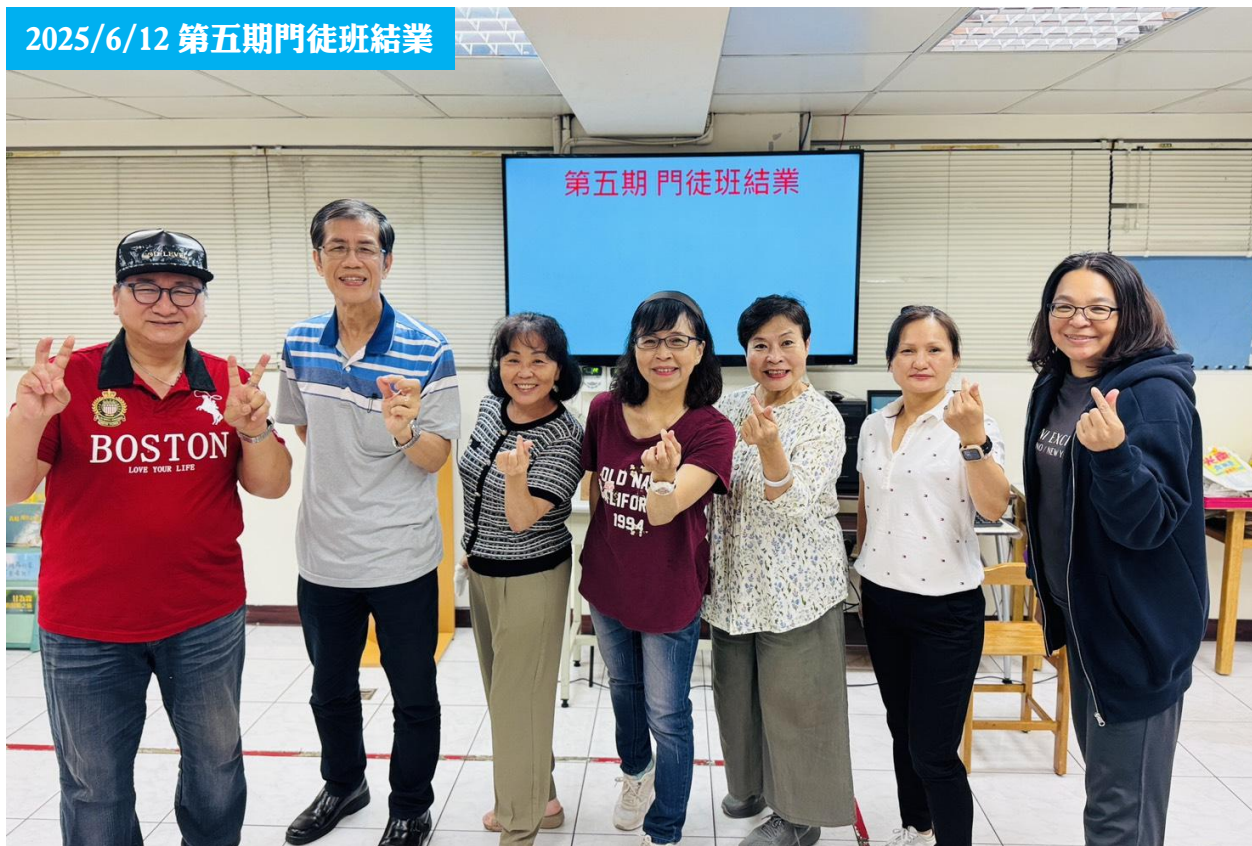
2025/6/12 第五期門徒班結業

◆兒童主日學預計於下主日(6/22)於聚會時間前往九乘九文具專家(三重正義店)購買上半年數星星活動結算之文具用品，再煩請小朋友活動當天攜帶計算機及環保袋