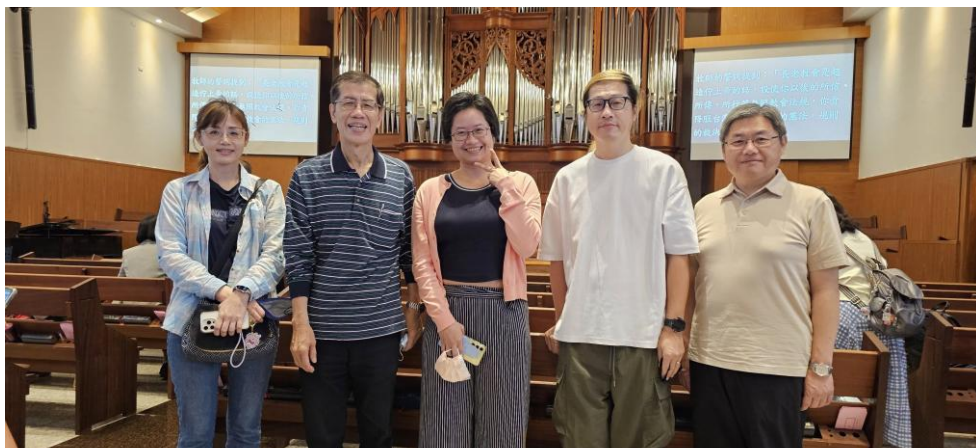
圖左：2025/5/3 中會長執初階在職訓練

◆本主日(5/11)為母親節，小朋友要獻唱「為我勇敢的媽媽」及「愛的總動員」，要將這美麗的歌聲獻給爸爸、媽媽及愛我們的天父，也祝福所有的媽媽「母親節快樂」。