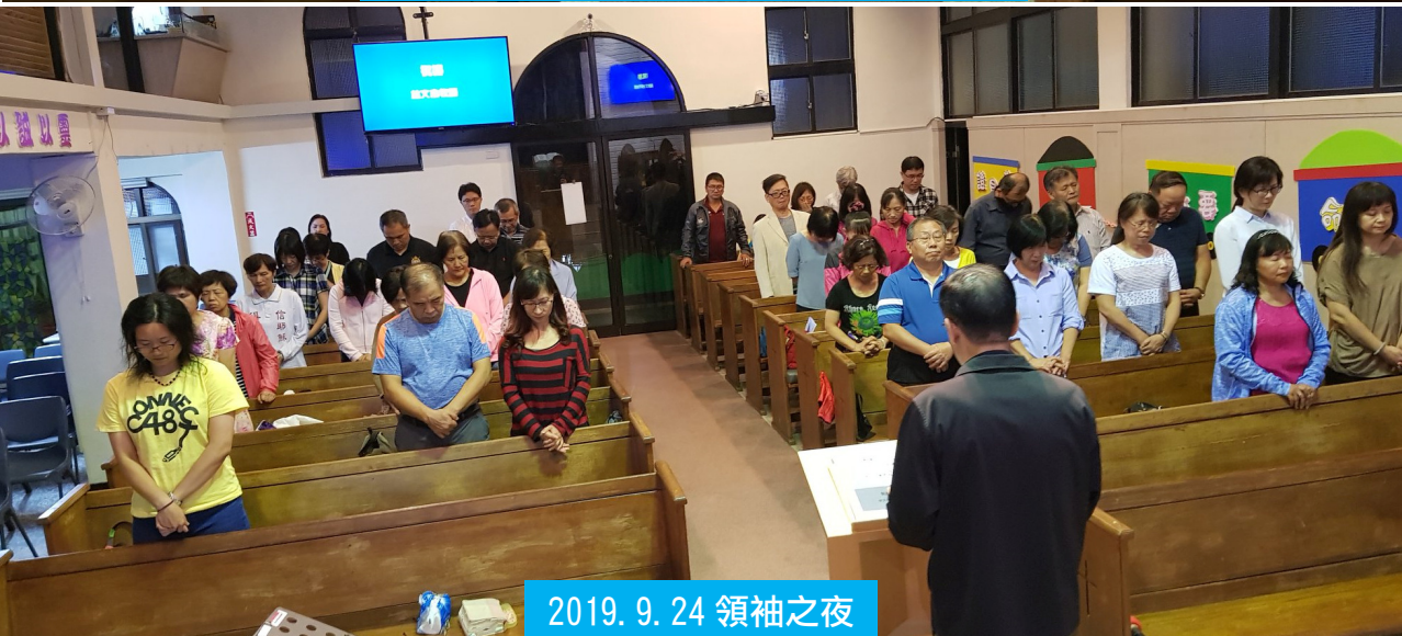
2019. 9. 24 領袖之夜