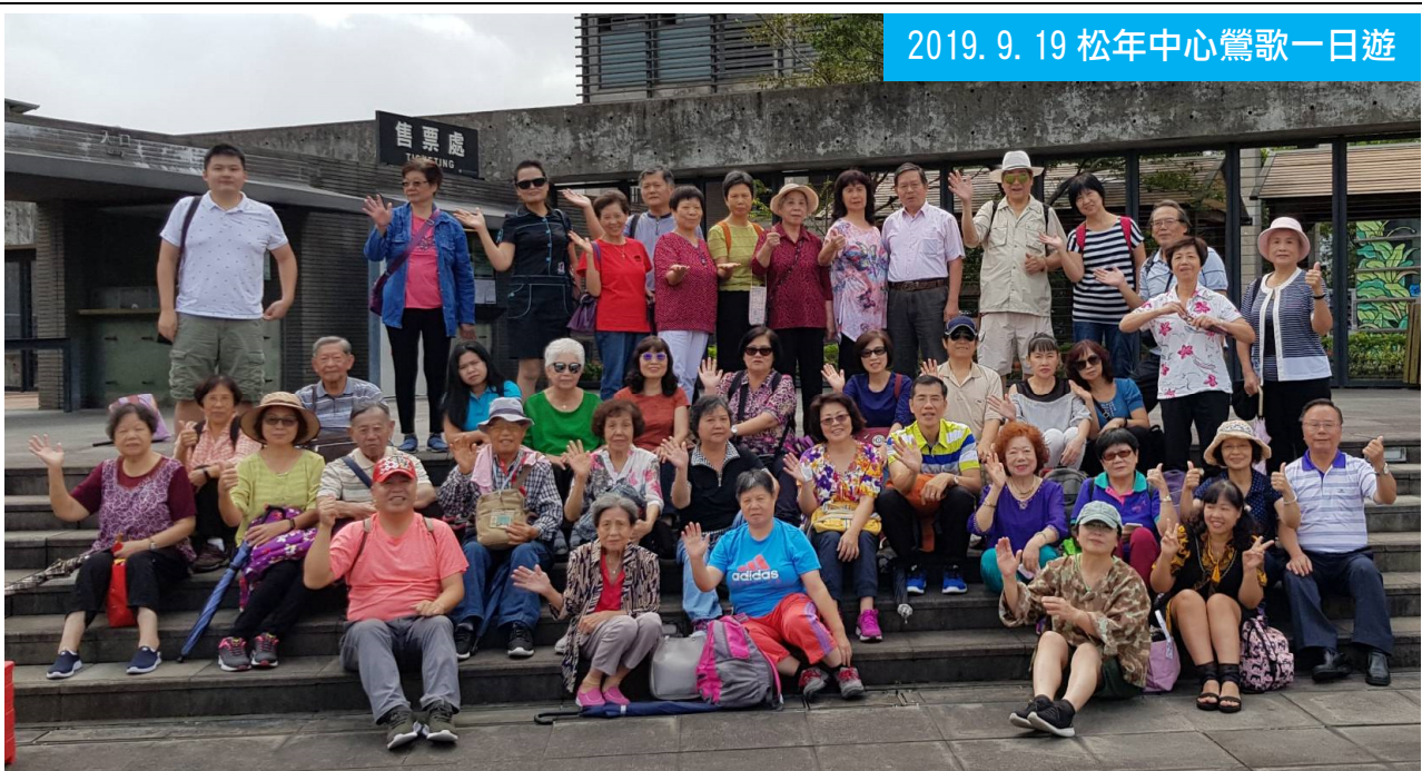
2019. 9. 19 松年中心鶯歌一日遊