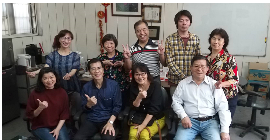
上圖(左、右)： 青少年牧區復活節彩蛋 包裝服事