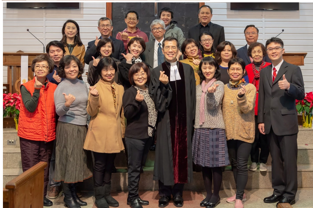
上圖左： 長老設立、封立 上圖右： 執事設立 下圖： 長執合照 (2018.12.30)

我們這許多人，在 基督裏成為一身， 互相聯絡作肢體， 也是如此。 (羅馬書十二：5)