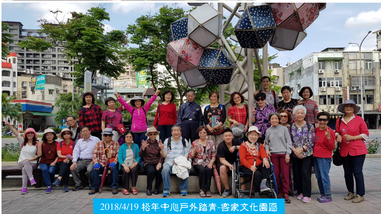
2018/4/19 裕年中心戶外踏青-客家文化園區