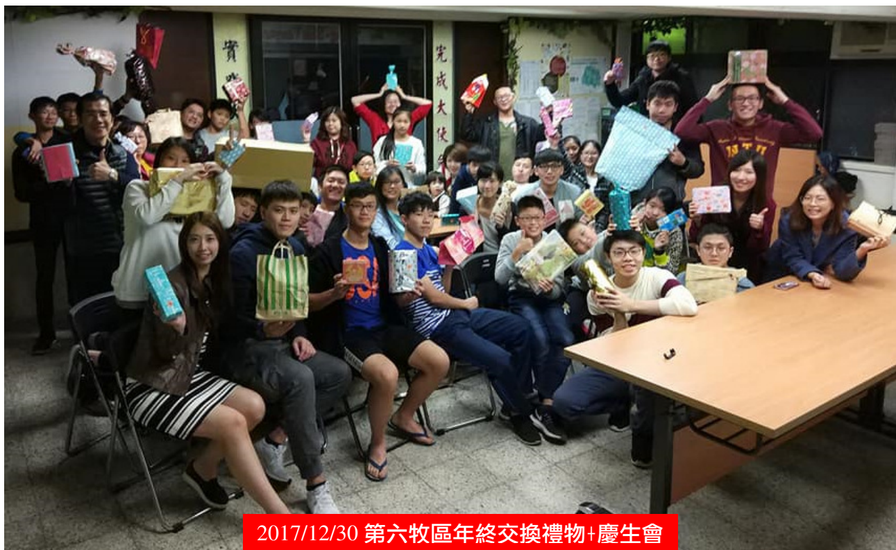
2017/12/30 第六牧區年終交換禮物+慶生會