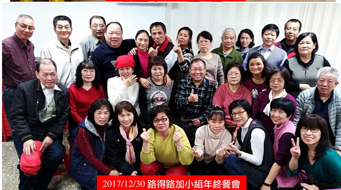
2017/12/30 路得路加小組年終餐會