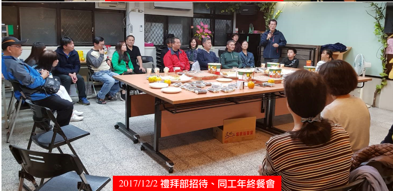
2017/12/2 禮拜部招待、同工年終餐會