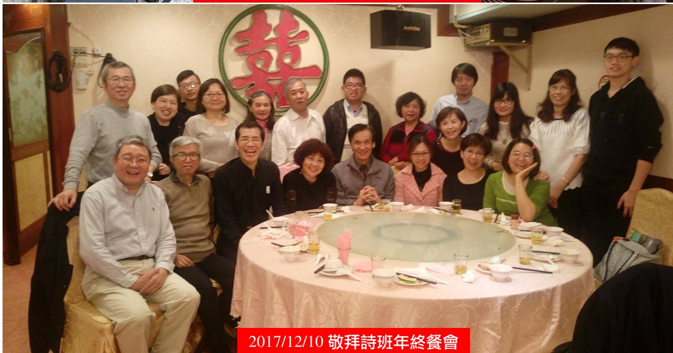
2017/12/10 敬拜詩班年終餐會