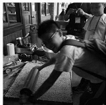
2017/10/29 全教會野外禮拜-宜蘭冬山河生態綠舟