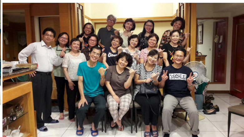
活水、泉源小組於牧師館小組聚會