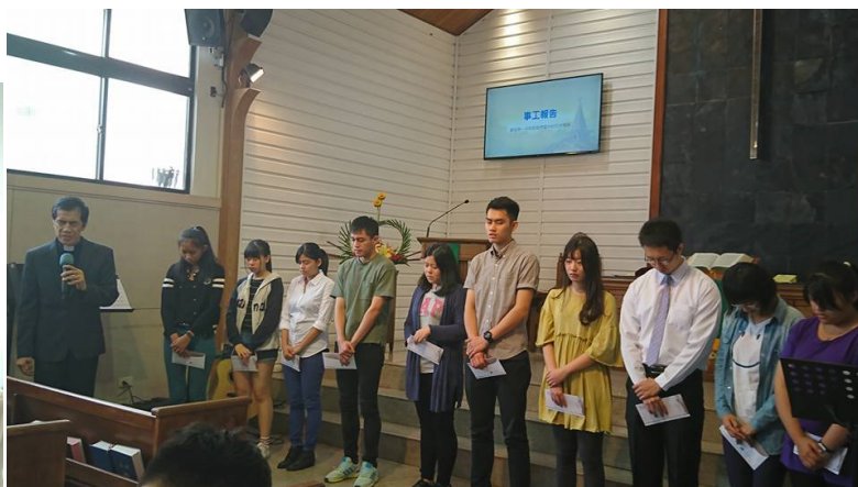
2017/10/8 第二場禮拜中頒發獎教會助學金