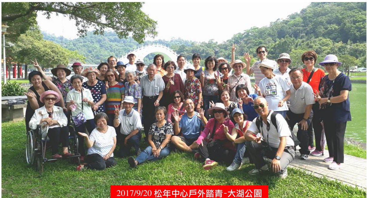
2017/9/20 松年中心戶外踏青-大湖公園