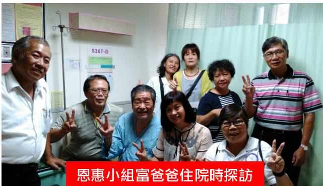
恩惠小組富爸爸住院時探訪