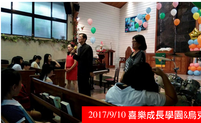
2017/9/10 喜樂成長學園&烏克麗麗老師聯合音樂發表會