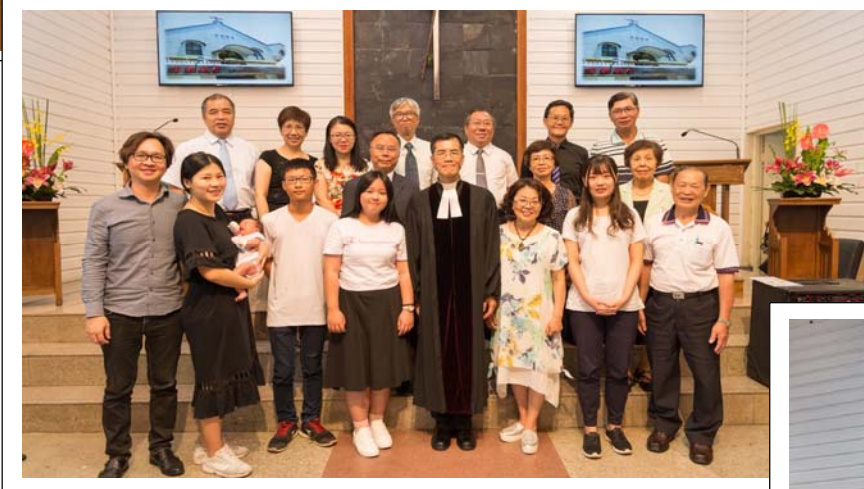
7/16 小兒洗禮、成人洗禮、堅信禮