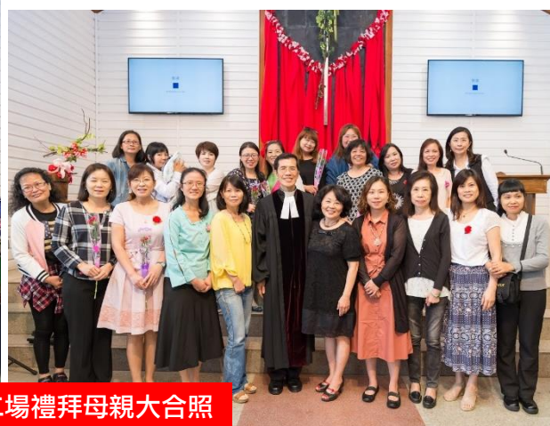
母親節感恩禮拜第一、二場禮拜母親大合照