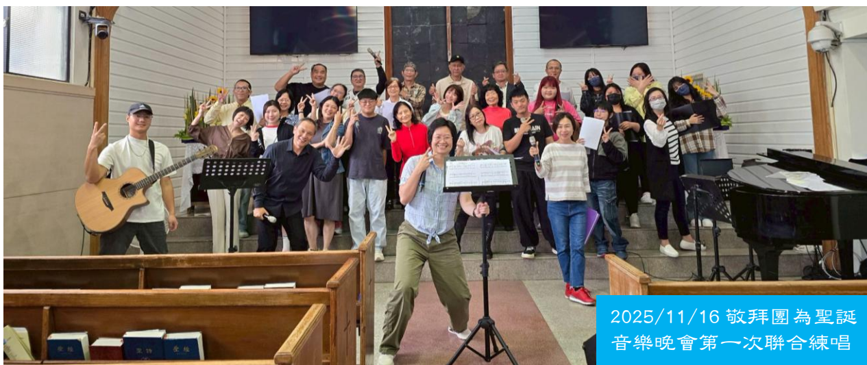
2025/11/16 敬拜團為聖誕音樂晚會第一次聯合練唱