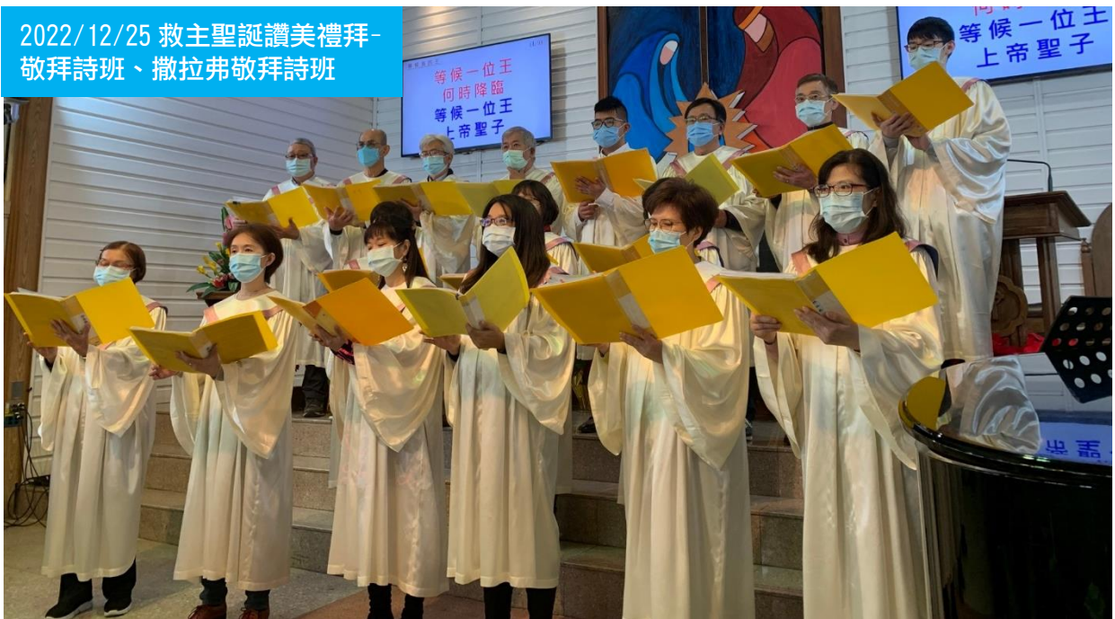
2022/12/25 救主聖誕讚美禮拜- 敬拜詩班、撒拉弗敬拜詩班