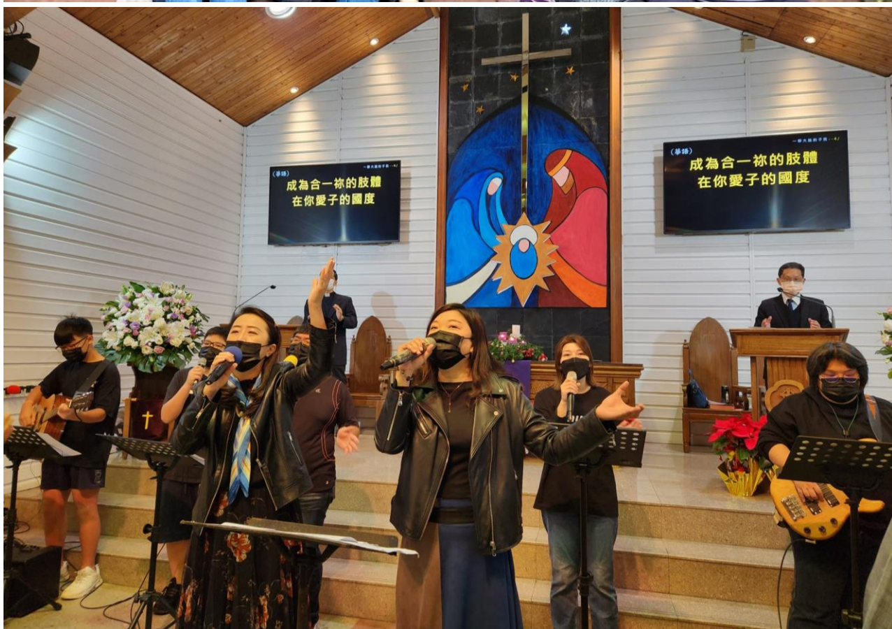
圖上：2022/12/6 社區部門同工退修會 圖下：2022/12/11 小組收割主日-以勒敬拜團 你，惟獨你是耶和華！你造了天和天上的天，並天上的萬象，地和地上的萬物，海和海中所有的；這一切都是你所保存的。天軍也都敬拜你。(尼希米記九；6)