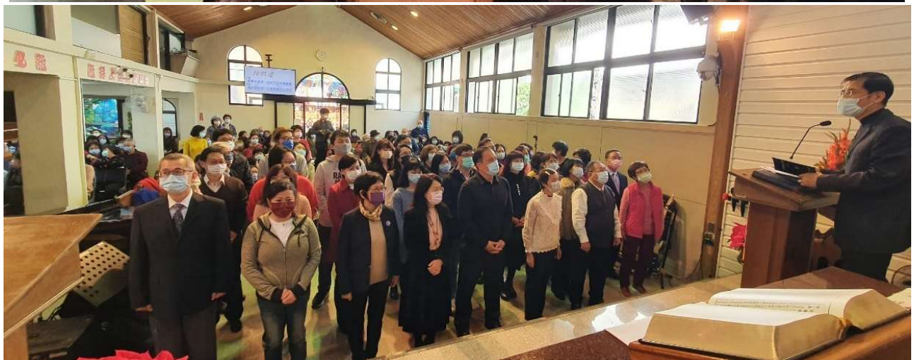
圖上：2021.1.3 各單位新任首長、輔導就任授職禮