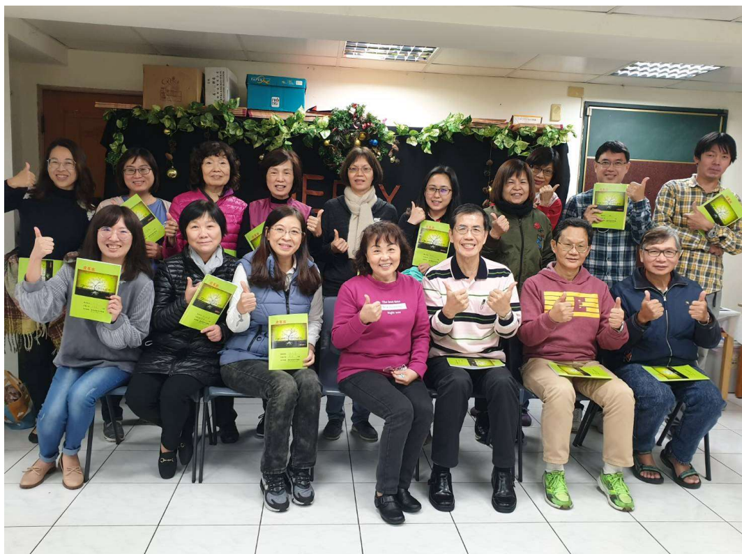
2020.12.24 第三期成長 班結業

應當更加殷勤，使你們所蒙的恩召和揀選堅定不移。你們若行這幾樣，就永不失腳。 (彼得後書一：10)