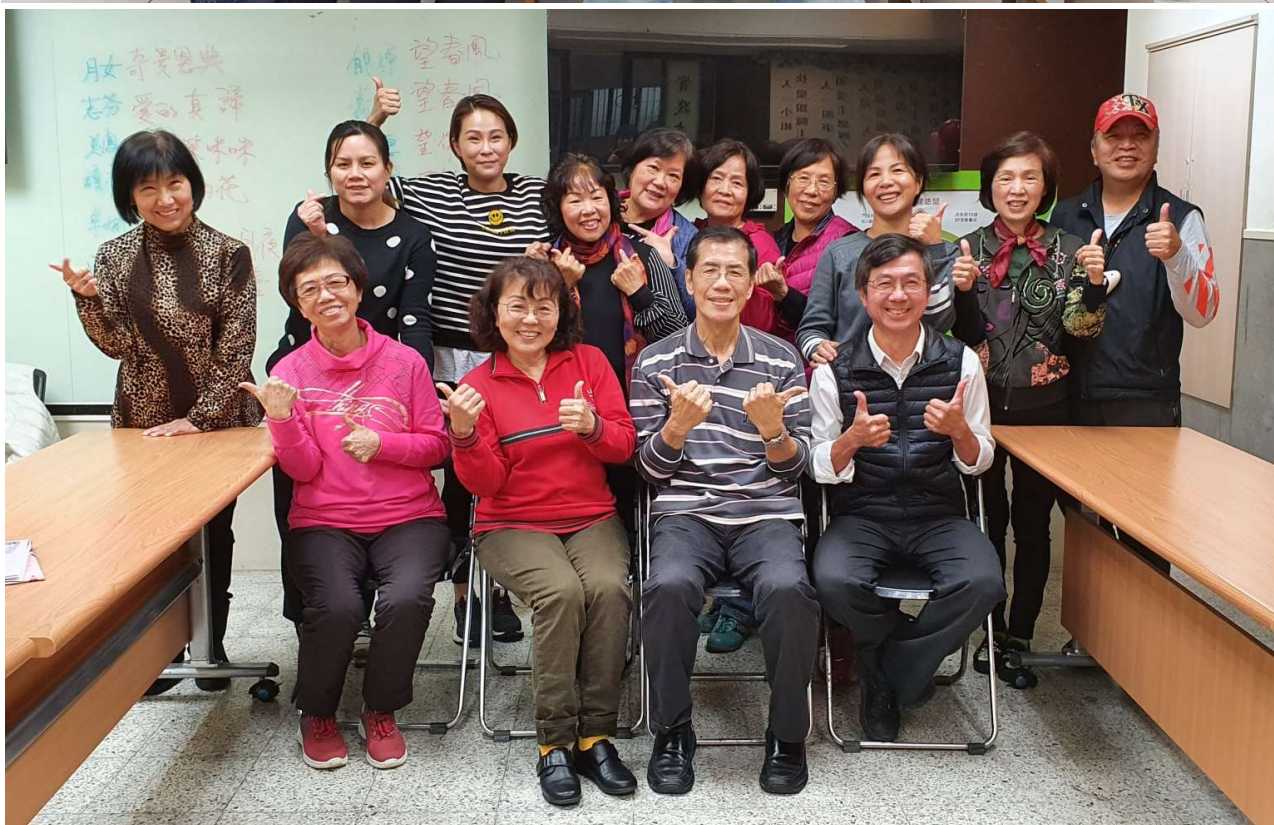
圖上：2020. 12. 19 週末日語班結業