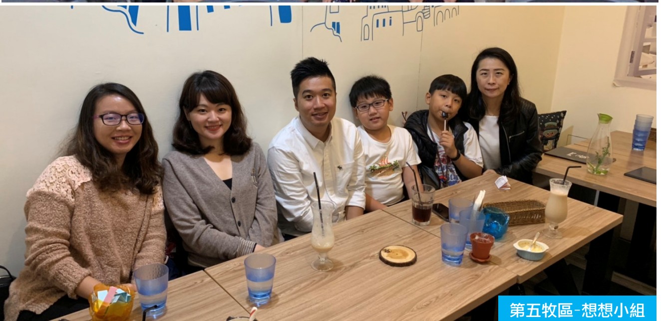
第五牧區-想想小組